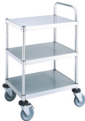
トップハンドル仕様

旋回も簡単なコンパクトなボディ。すっきりとしたオープンなデザインは、提供する料理の視認をやすくします。オプションにより、サイドハンドル、トップハンドルが選択できます。