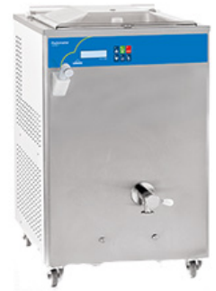
PASTOMASTER 120XPL P

7つのプログラムを搭載し、用途に合わせた面倒な設定をせず、低温殺菌(68℃)・中温殺菌・高温殺菌(85℃)・チョコレート殺菌(90℃)・冷却・貯蔵の工程を簡単に処理が行えます。