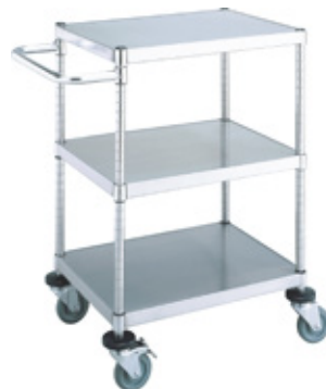
サイドハンドル仕様