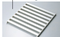
アルミニウム製棚板