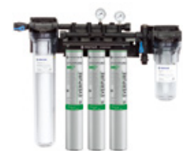
ハイフロー-CSRトリプル