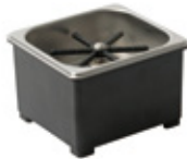
サイズ(mm): W178×D190×H120 価格: オープン価格