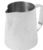
サイズ: 20oz 価格: オープン価格