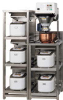
RMC-10T ※炊飯器及び炊飯器ラップは別売り

パックされた計量済みの精米を入れるだけで洗米が可能。米質に合わせた洗米パターンの設定があるため、ムラのない研ぎあがりを実現します。また、少ない水量で洗米するので節水にも貢献します。AW シリーズは、リモコン操作で洗米から排出まで自動で運転します。