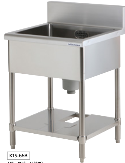
K1S-66B (バックガード付き)