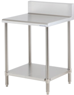
KT-66B (バックガード付き)

調理の下ごしらえだけでなく、調理機器の設置にも活用できる作業台。脱着式スノコ棚を185mmに設定を高くしたことで、清掃性を向上。手の触れる部分は全て平折りしているため、安全性にも優れます。