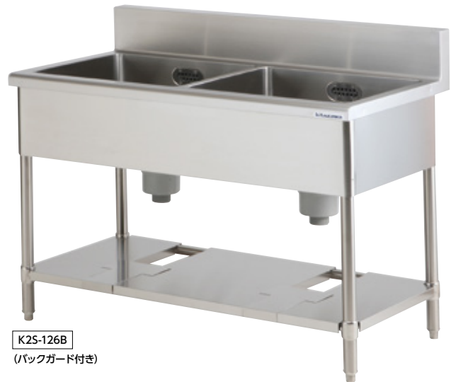
K2S-126B (バックガード付き)