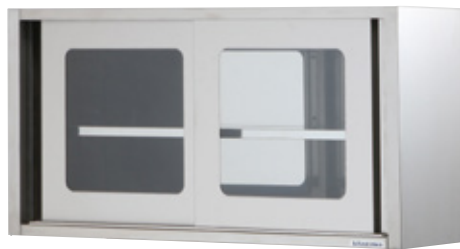
KOC-12356G (ガラスドアタイプ)